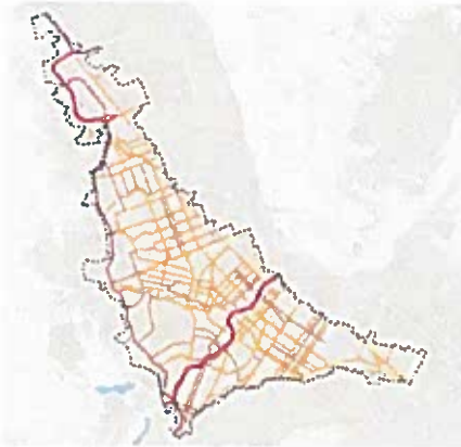
Fig 2 Polígono prioritario IMPLAN, 2019

2. En el muestro general planteado en el apartado anterior (Fig.1), ofrecer la posibilidad de segmentar el territorio, para observar, monitorear y evaluar también resultados en dos áreas fundamentales; el polígono prioritario marcado en la Fig. 2 y el resto de la zona urbana.